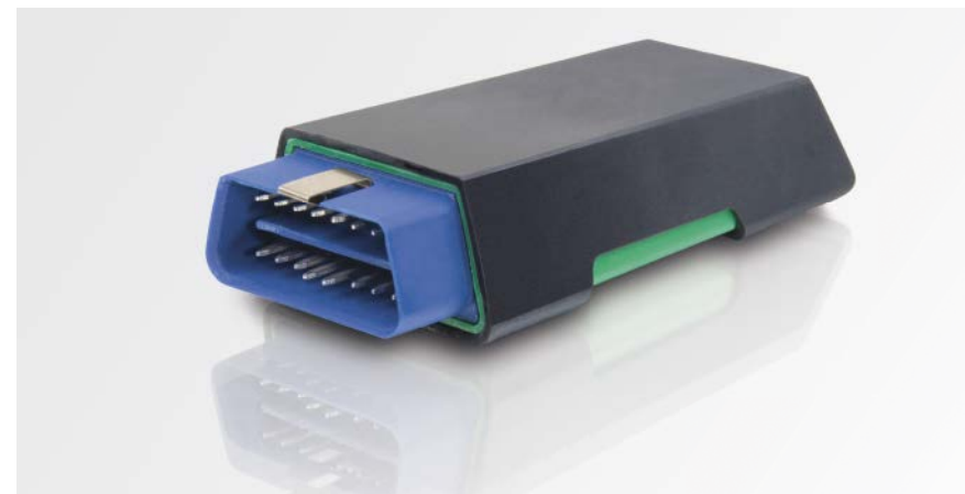
Pequena mas poderosa – dentro da compacta pen USB esconde-se o software mega macs PC completo

tavelmente, o mega macs PC possibilita a comunicação sem fios entre o veículo e o PC da oficina, dentro de um raio de ação até 50 metros. A leitura do n.º chassis do veículo ocorre imediatamente após a ligação. Assim, evitam-se de antemão confusões ou a introdução errada deste número de 17 caracteres. Os códigos de erro lidos, bem como as alterações às configurações básicas e as codificações são guardados no Car History, ficando assim permanentemente acessíveis mesmo após a conclusão dos trabalhos.